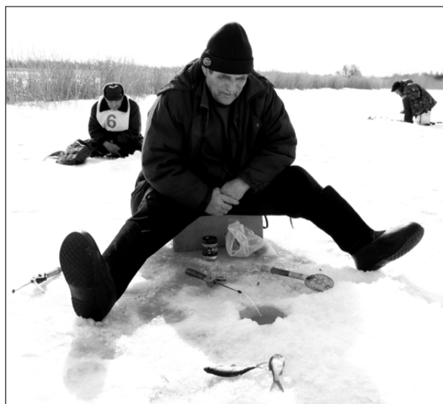
Клёв рыбы практически отсутствовал, но в таких экстремальных условиях мастера зимней рыбалки сумели разыграть первенство