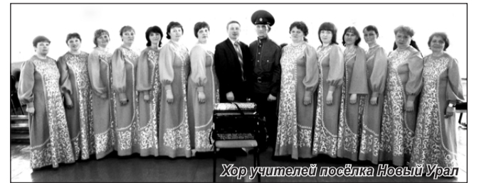
Хор учителей посёлка Новый Урал

Все коллективы общеобразовательных учреждений Вар-