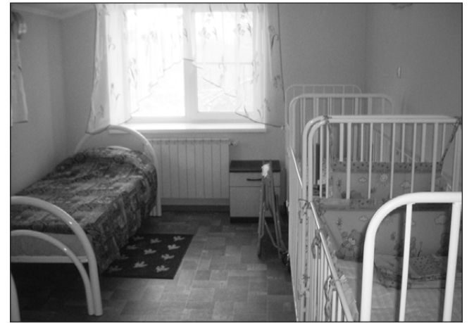
Материнская обитель. Комната для молодых мам